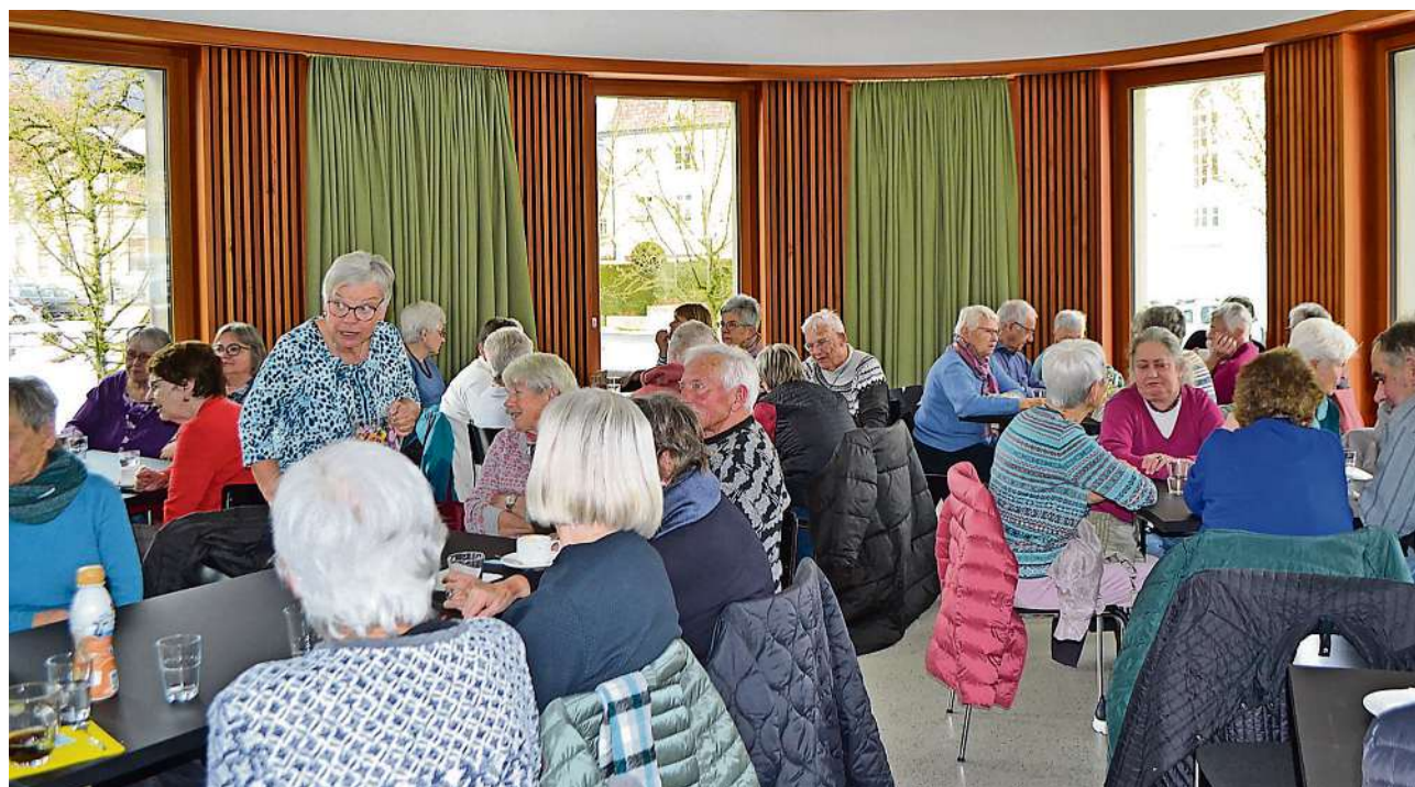
Das in Ebnat-Kappel im Januar durchgeführte Kafi Zeitgut war sehr gut besucht.

Sollte die Finanzierung langfristig nicht gesichert werden können, hätte dies spürbare Folgen. Bestehende Engagements würden zwar teilweise weiterlaufen, doch die professionelle Koordination und Betreuung würde fehlen. Besonders vulnerable Menschen hätten erschwerten Zugang zu Unterstützung. Mehr Personen müssten frühzeitig in Heime eintreten. Einsamkeit und soziale Isolation würden zunehmen – mit entsprechenden gesundheitlichen und finanziellen Folgen. Die Organisation und Betreuung von Freiwilligenarbeit muss deshalb von den Gemeinden unterstützt werden. Sie ist eine Investition in die Zukunft unserer Gesellschaft.