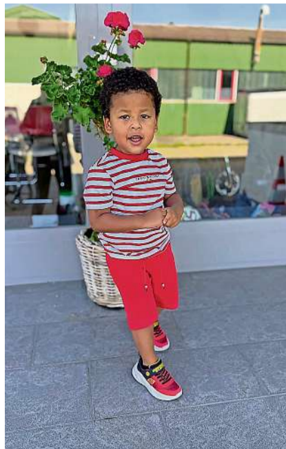
Bei Margaretha's Bébé- und Kinderparadies finden Sie preiswerte und schicke Kinderkleider.