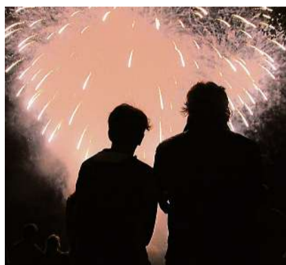
Einzigtätiges Feuerwerk über dem Walensee – am 28. Juni wieder am Seebecken Weesen zu erleben.

Das Seefäscht lockt nach neunjähriger Pause wieder mit einem vielfältigen musikalischen Programm, kulinarischen Highlights, einem Klassentreffen und einem atemberaubenden Feuerwerk über dem Walensee. Zahlreiche Musikbands sorgen auf vier Bühnen entlang des Seebeckens für ein abwechslungsreiches Musikprogramm. Von mitreissenden Live-Bands über traditionelle Volksmusik bis hin zu energiegeladenen DJ-Sets bietet das Seefäscht für jeden Musikgeschmack das passende Erlebnis. Der Samstag, 28. Juni, steht neben dem musikalischen Programm auch im Zeichen der Erinnerungen. Ab 14 Uhr sind alle ehemaligen Schülerinnen, Schüler und Lehrpersonen aus Amden und Weesen eingeladen, sich beim grossen Klassentreffen zu versammeln. Ein Programmpunkt, der im wahrsten Sinne des Wortes Generationen verbindet und die Chance bietet, alte Freundschaften aufleben zu lassen. Den krönenden Abschluss des Seefäschts bildet das grosse Feuerwerk am Samstagabend um 22.45 Uhr. Sobald die Dunkelheit über den Walensee hereinbricht, wird der Himmel von funkelnden und farbenprä-